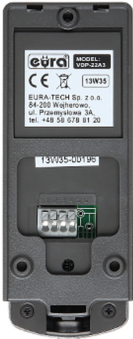
Widok od strony mocowania monitora: