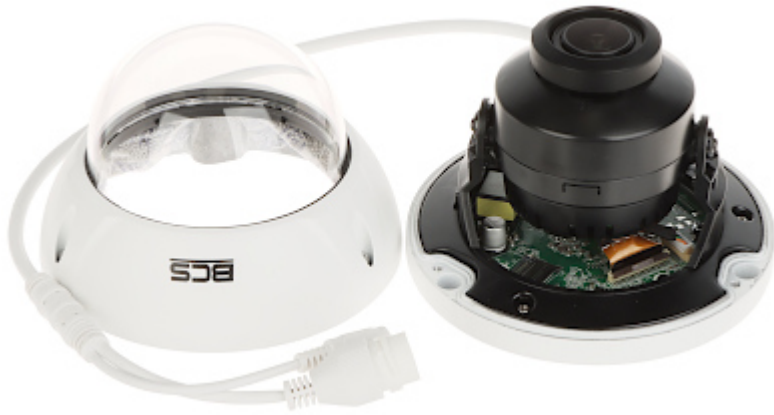
Gniazdo karty pamięci: