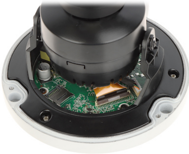
Widok od strony mocowania: