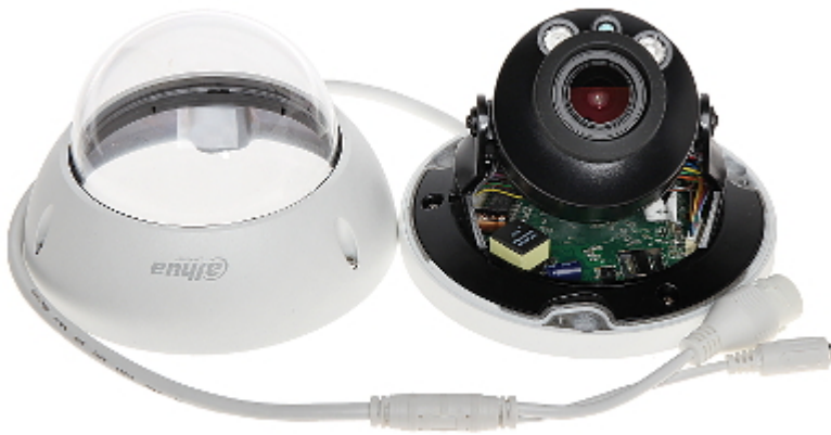
Gniazdo karty pamięci: