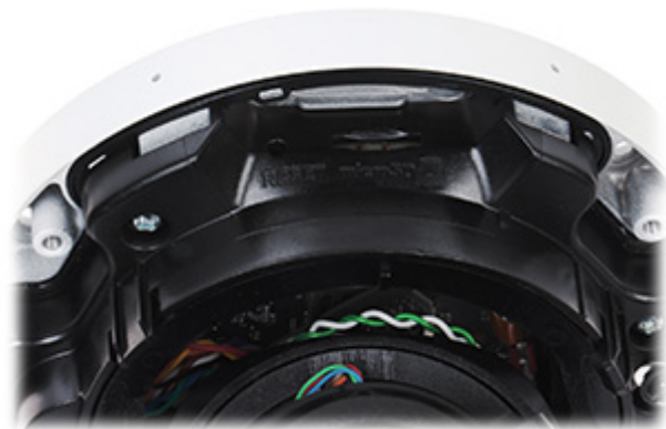
Gniazdo karty pamięci oraz przycisk "Reset":