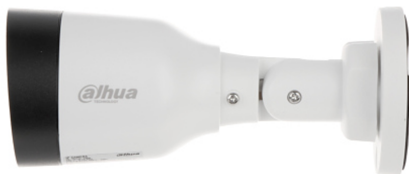
Widok od strony mocowania kamery: