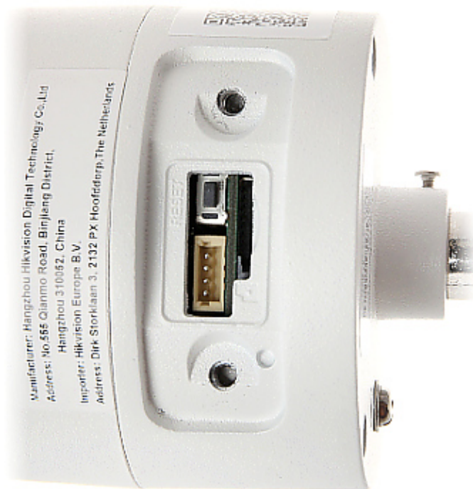
Widok od strony mocowania kamery: