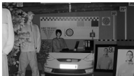
Obraz z kamery przy silnym świetle ustawionym na wprost kamery: