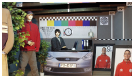
Obraz z kamery przy pracy w nocy z włączonym wbudowanym oświetlaczem IR: