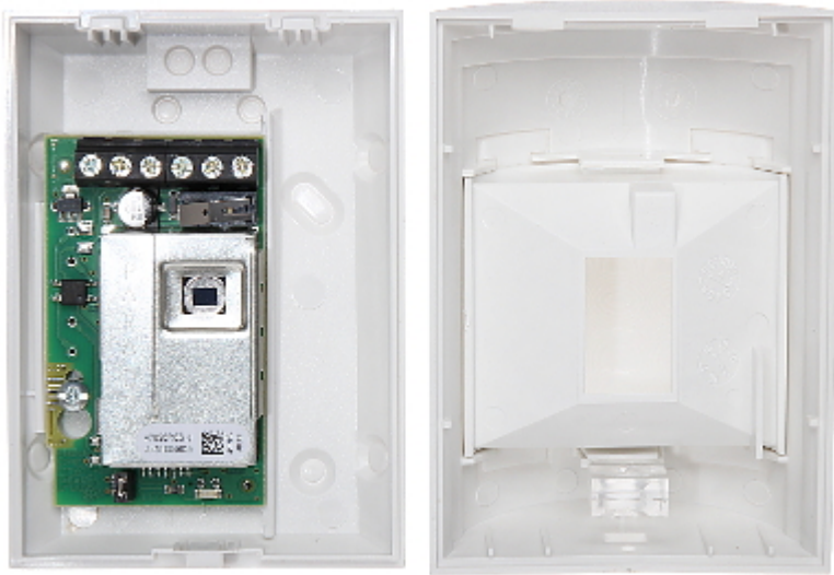
Widok od strony mocowania: