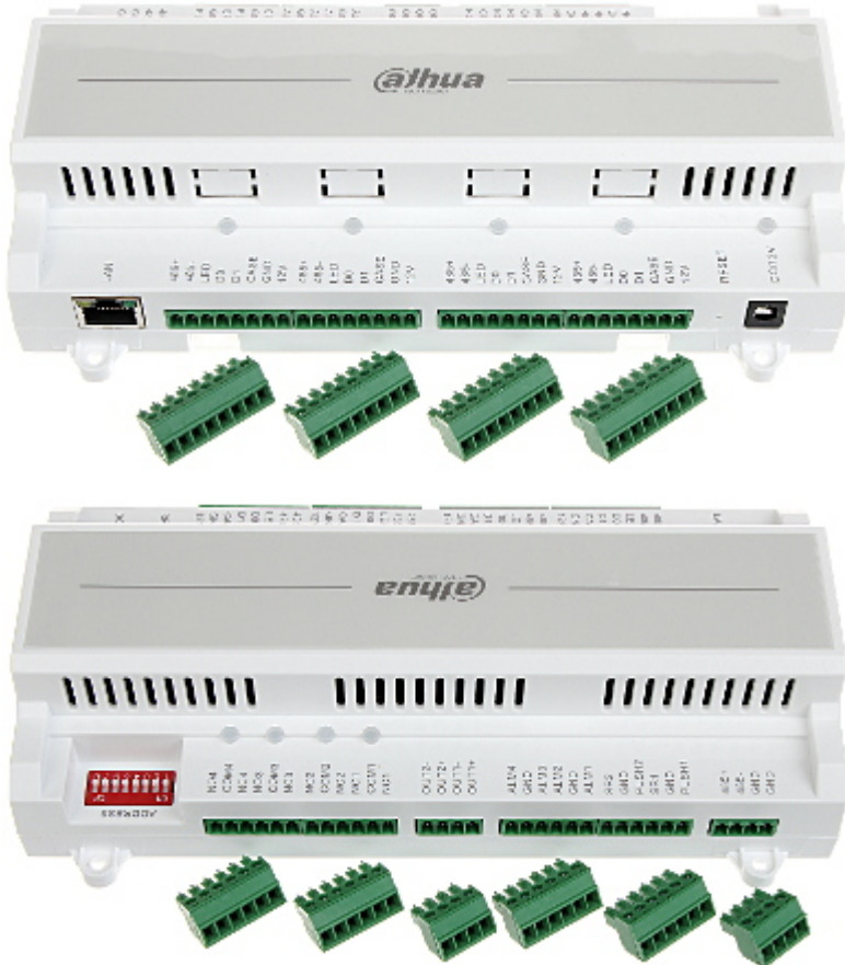
Widok od strony mocowania: