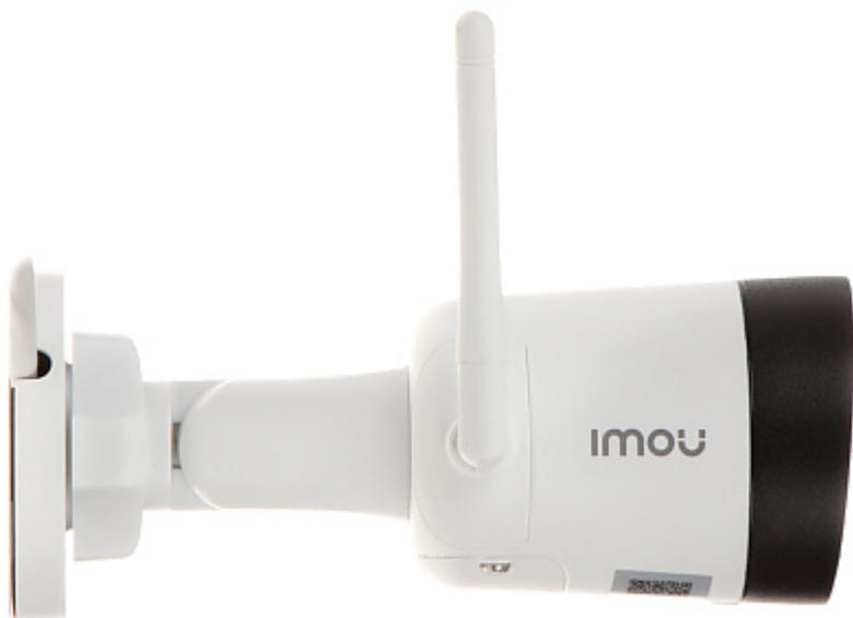
Gniazdo karty pamięci: