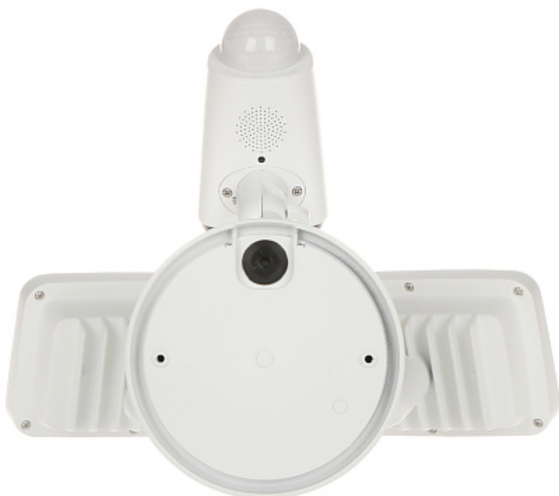
Widok od spodu (po zdjęciu pokrywy):