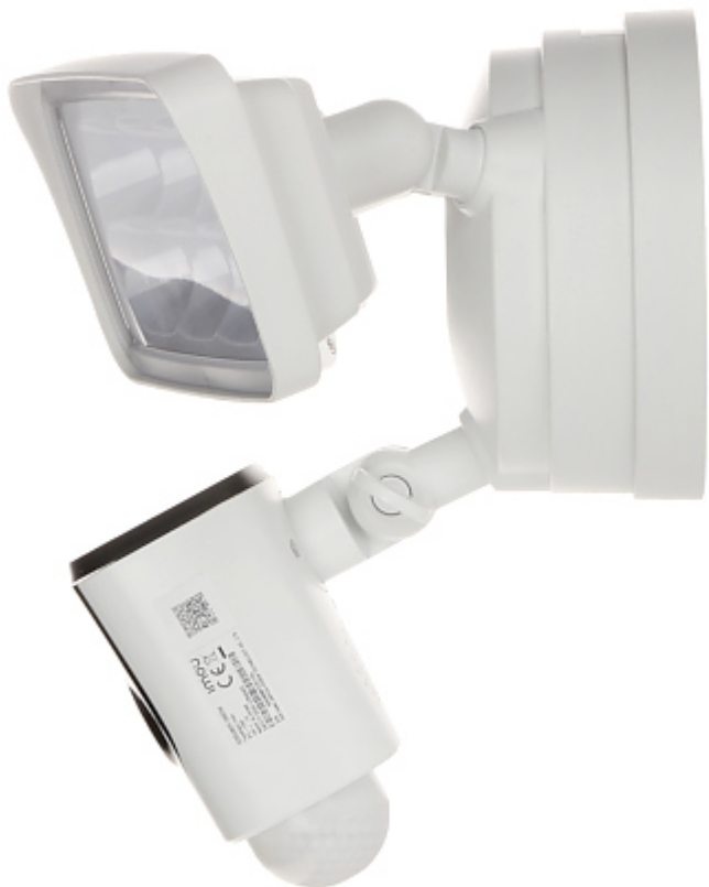
Widok od spodu: