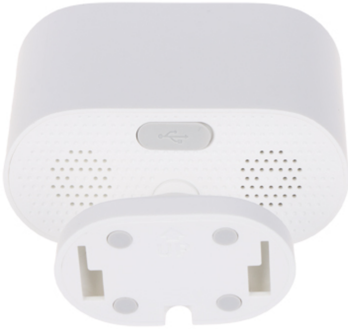
Złącze micro USB: