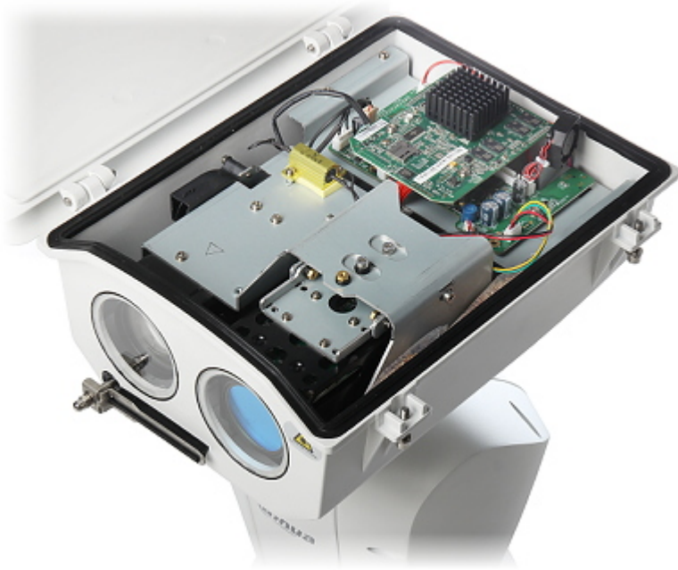
Gniazdo karty pamięci: