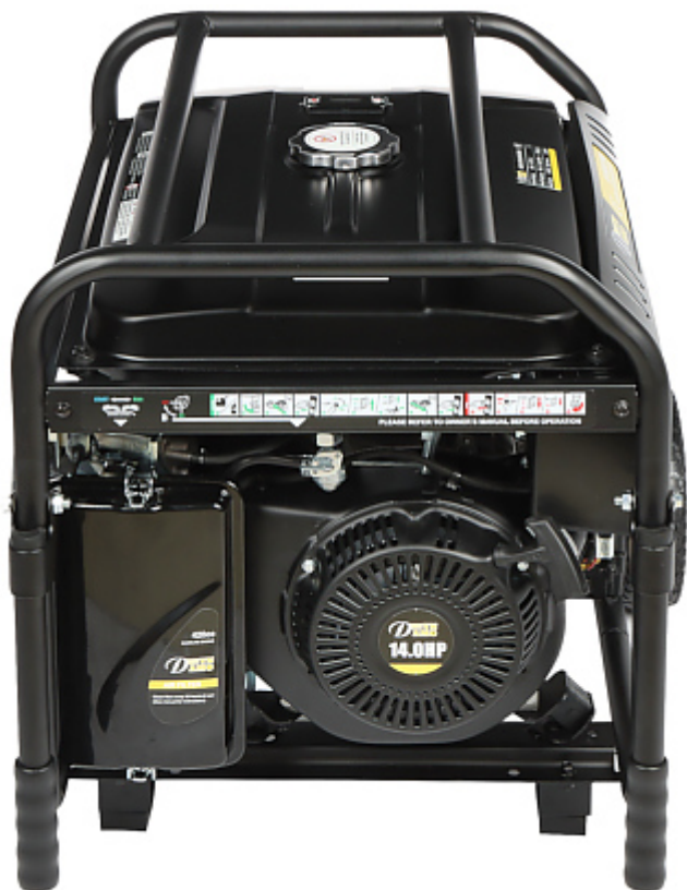
Dźwignia ssania i zawór paliwa: