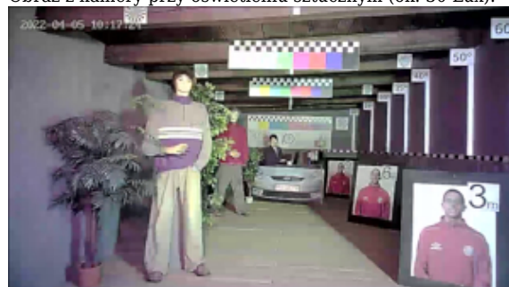
Obraz z kamery przy oświetleniu sztucznym (ok. 30 Lux):

DELTA-OPTI Monika Matysiak; https://www.delta.poznan.pl POL; 60-713 Poznań; Graniczna 10 e-mail: delta-opti@delta.poznan.pl; tel: +(48) 61 864 69 60