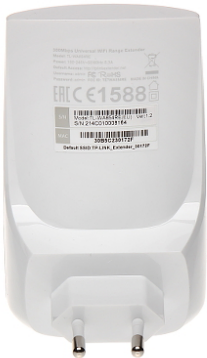
Widok od spodu: