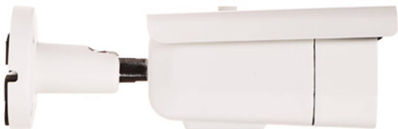
Widok od spodu: