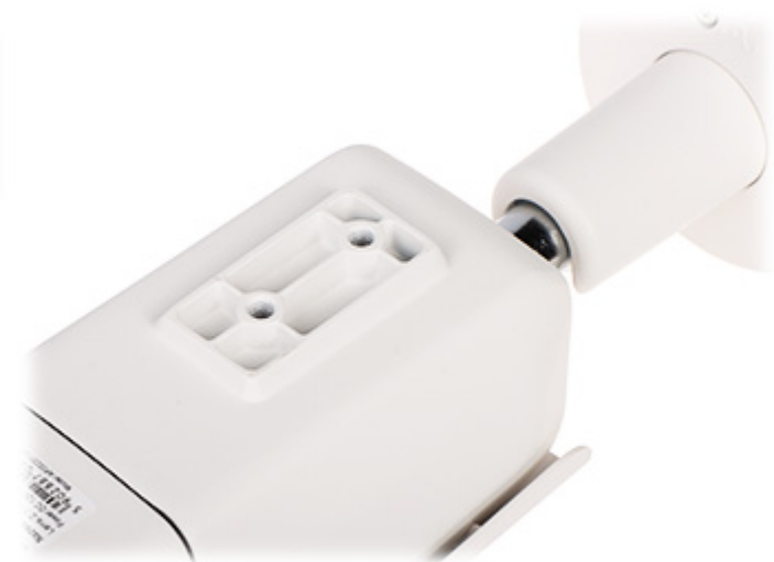
Widok od strony mocowania: