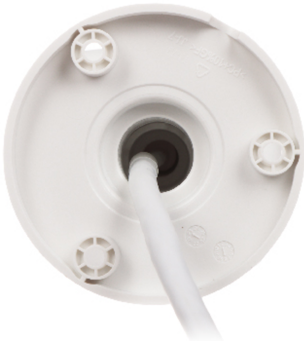
Wymiary montażowe kamery: