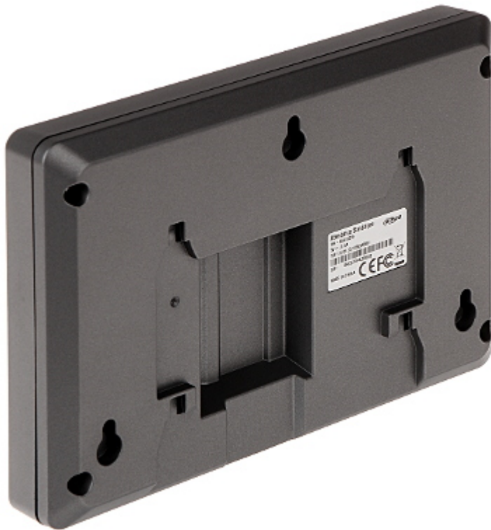
Widok z dołu: