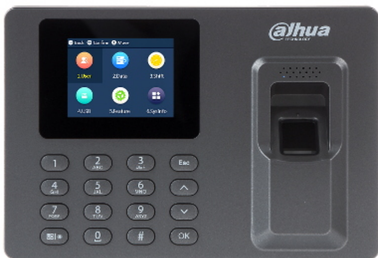
Widok od strony mocowania: