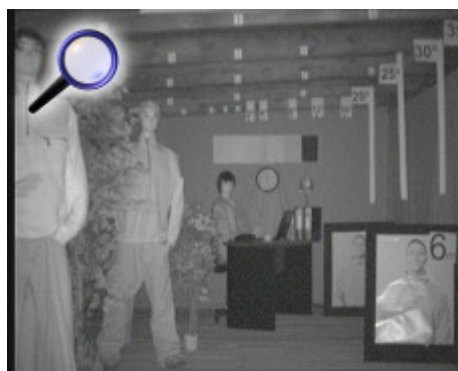
Obraz z kamery przy silnym świetle ustawionym na wprost kamery: