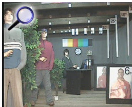
Obraz z kamery przy pracy w nocy z włączonym wbudowanym oświetlaczem IR: