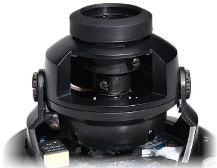
Widok od strony mocowania: