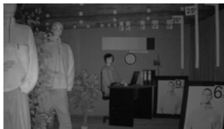
Obraz z kamery przy silnym świetle ustawionym na wprost kamery: