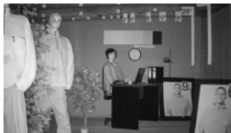
Obraz z kamery przy silnym świetle ustawionym na wprost kamery: