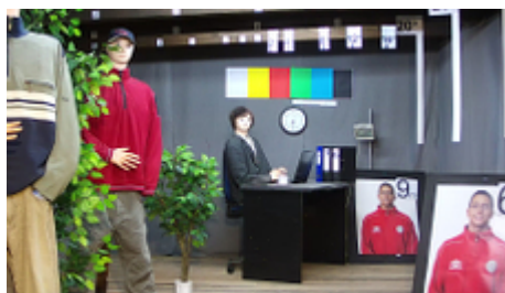
Obraz z kamery przy pracy w nocy z włączonym wbudowanym oświetlaczem IR: