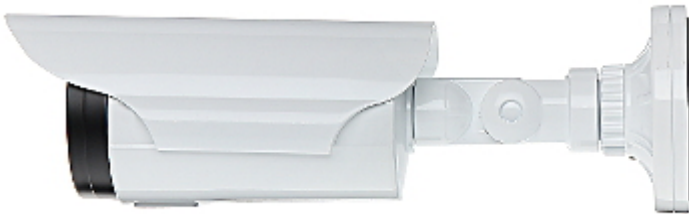
Widok od spodu: