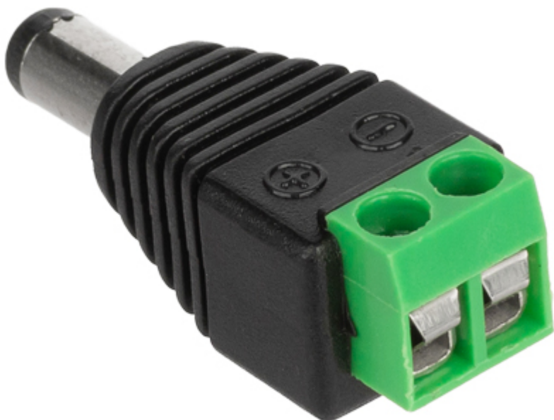
Przykład zastosowania z kablem YAP-2x0.5/100: