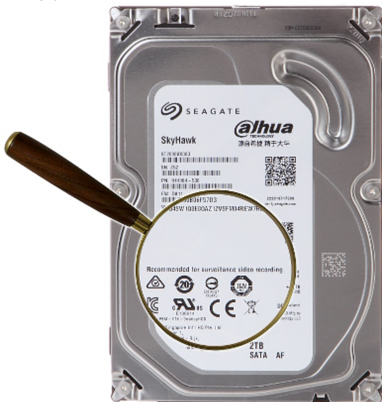
Dyski Seagate SKYHAWK oznaczone symbolem "surveillance video recording" dedykowane są do pracy w systemach wideo. Konstrukcja pozwala na bezproblemowy zapis kilkudziesięciu strumieni Full HD w trybie 24/7. Złącza: