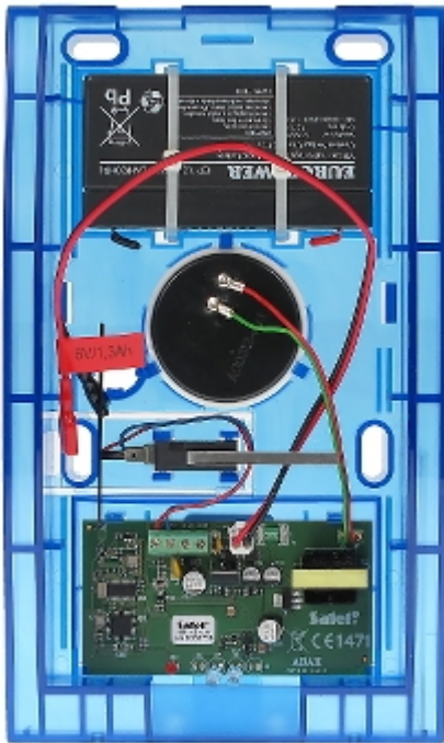
Widok od strony mocowania: