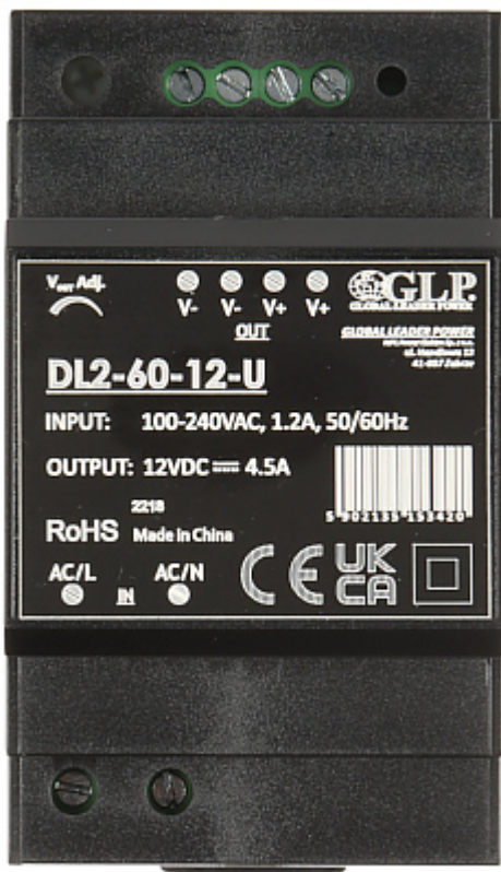
Panel tylny (mocowanie do szyny DIN):