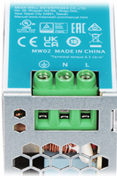
Panel tylny (mocowanie do szyny DIN):