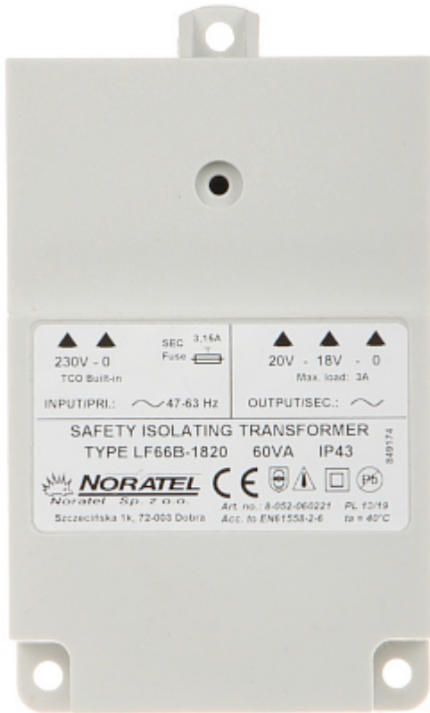
Widok od strony mocowania: