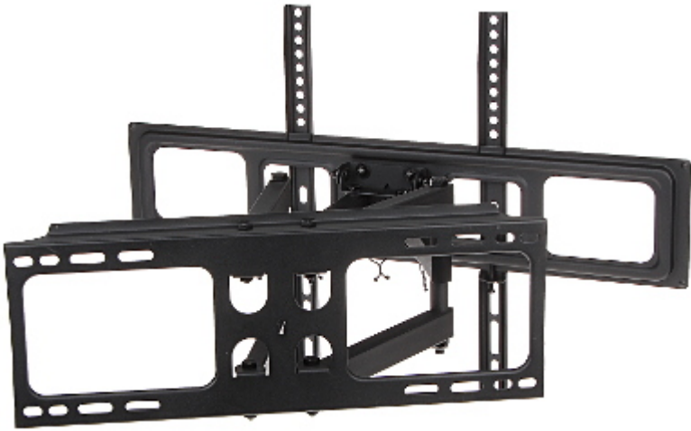
Możliwości regulacji uchwytu: