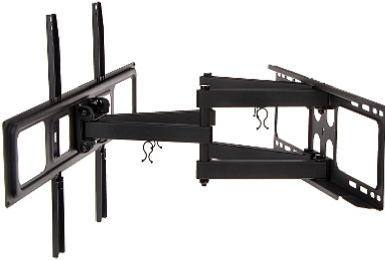
Widok od strony mocowania do ściany: