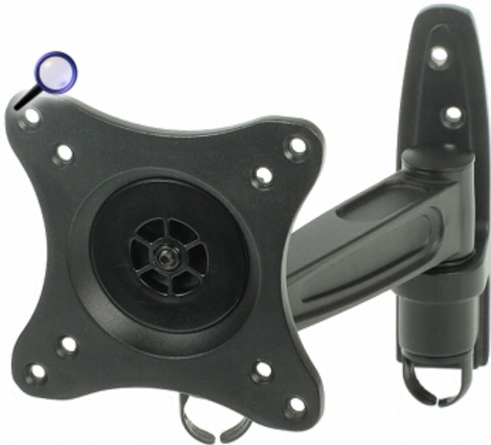
Widok od strony mocowania do ściany: