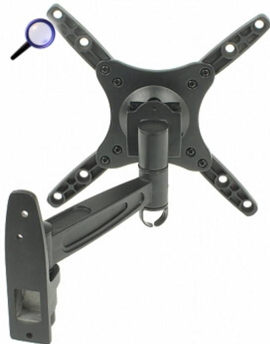
Możliwości regulacji uchwytu: