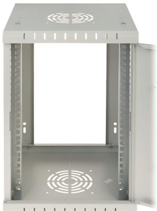
Otwór na wentylator: