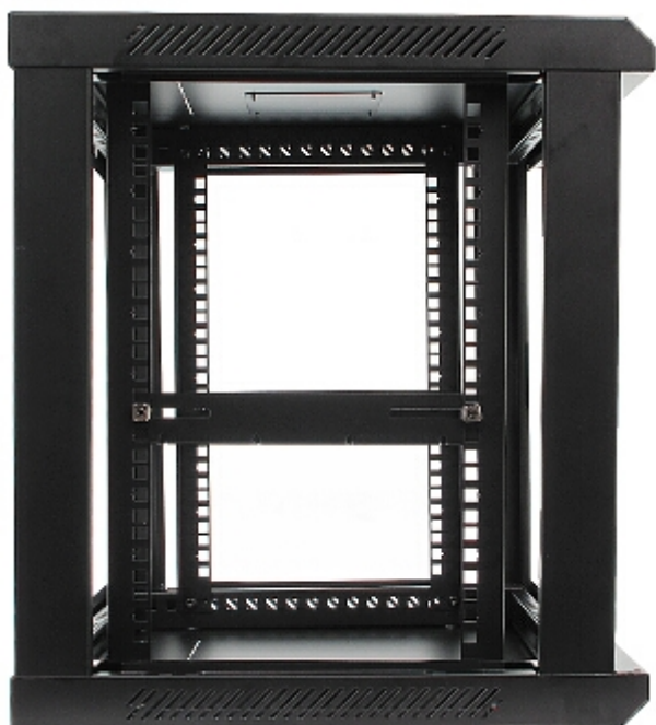
Widok z tyłu (bez ścian bocznych oraz tylnej pokrywy):