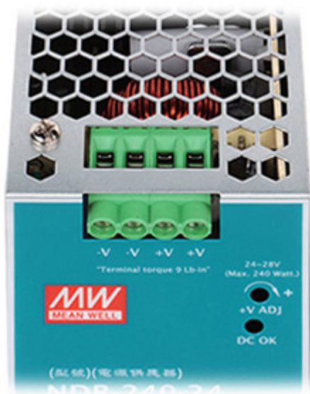
Panel tylny (mocowanie do szyny DIN):