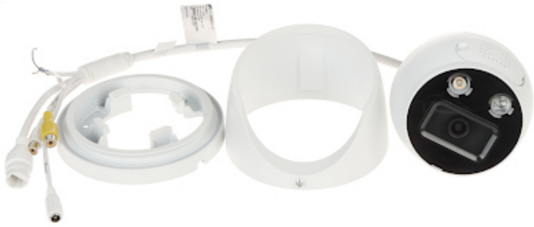
Gniazdo karty pamięci oraz przycisk "Reset":