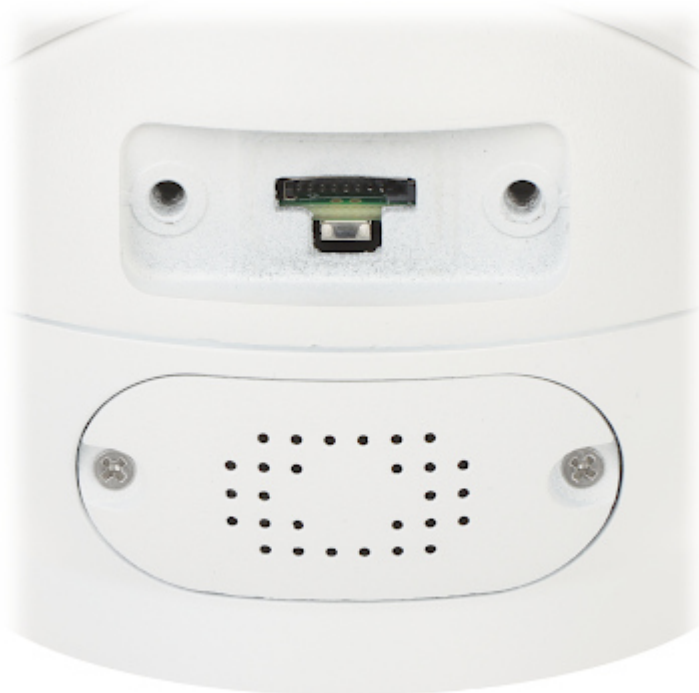
Widok od strony mocowania: