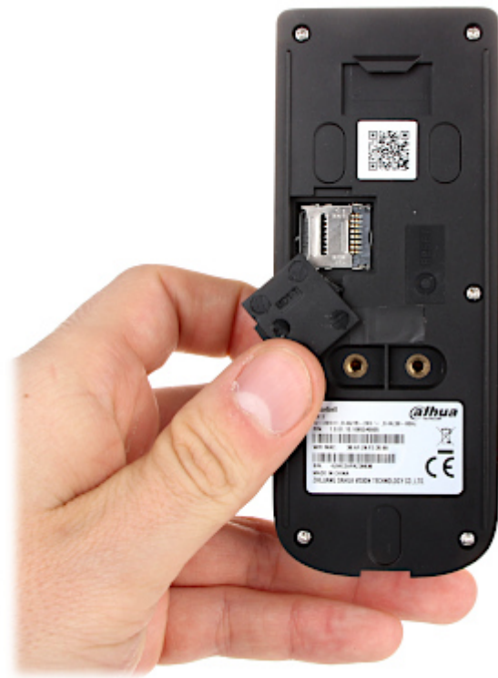
Moduł dzwonka Wi-Fi: