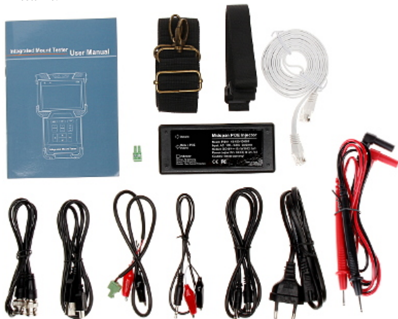
Urządzenie wraz z akcesoriami mieści się w poręcznej torbie: