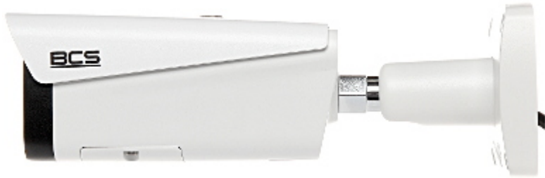
Widok od strony mocowania: