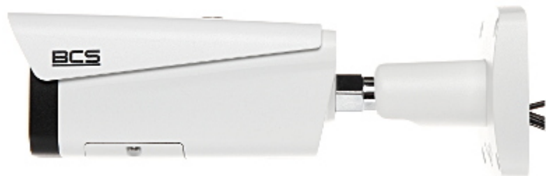
Widok od strony mocowania: