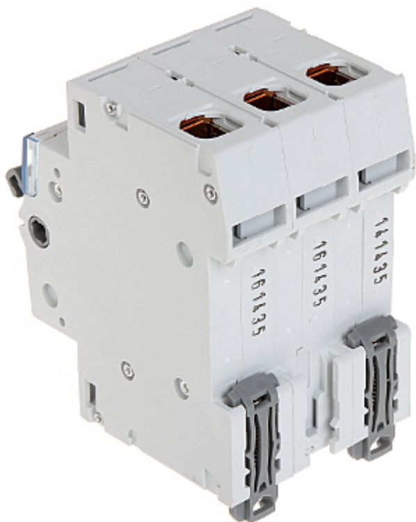
Widok z dołu: