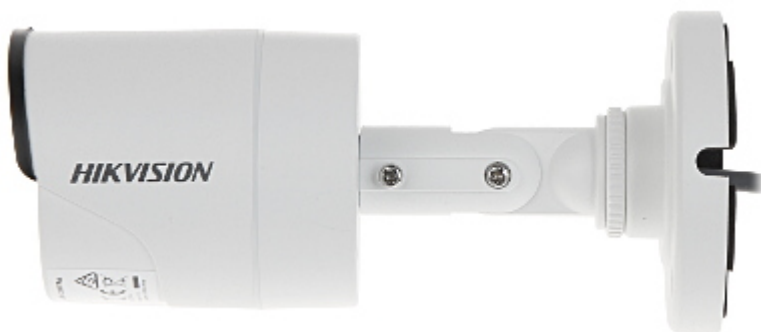
Widok od strony mocowania: