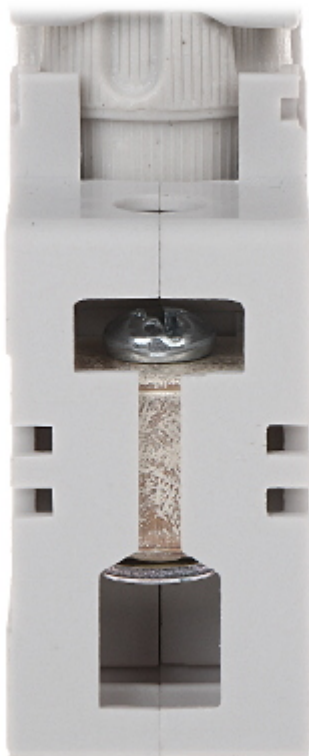
Widok od strony mocowania: