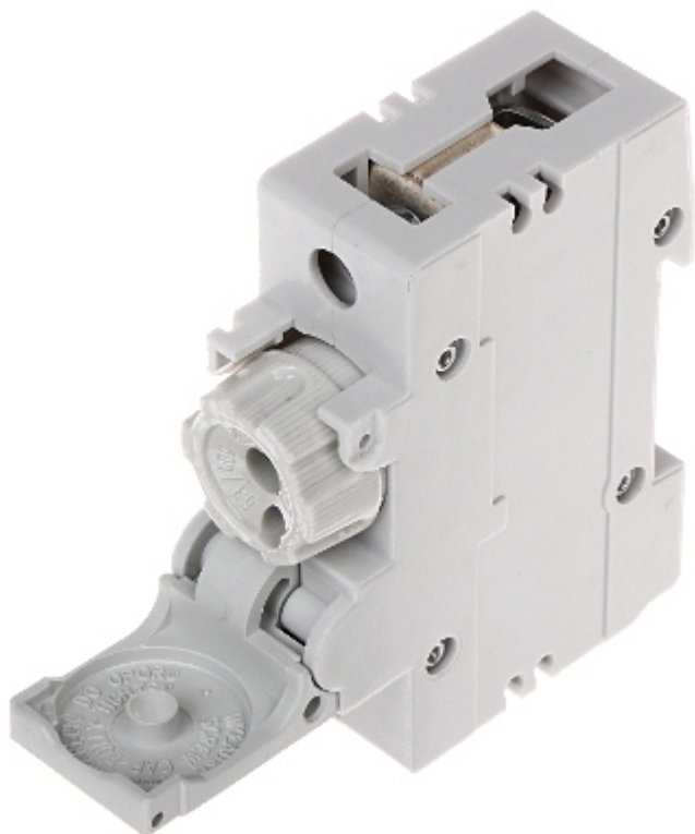
Widok od spodu: