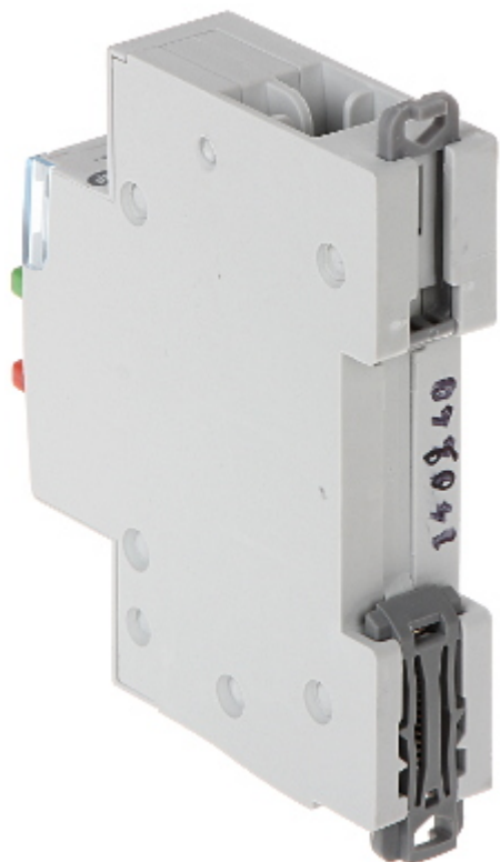
Widok z dołu: