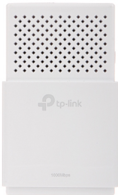
Widok od spodu: