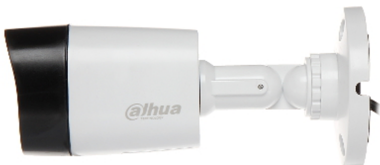
Widok od strony mocowania kamery: