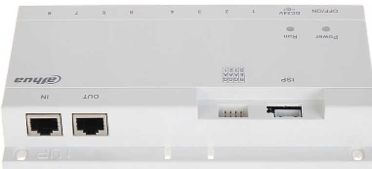
Widok od strony mocowania: