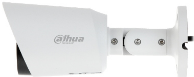
Widok od strony mocowania kamery: