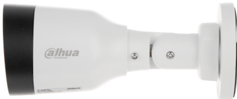
Widok od strony mocowania kamery: