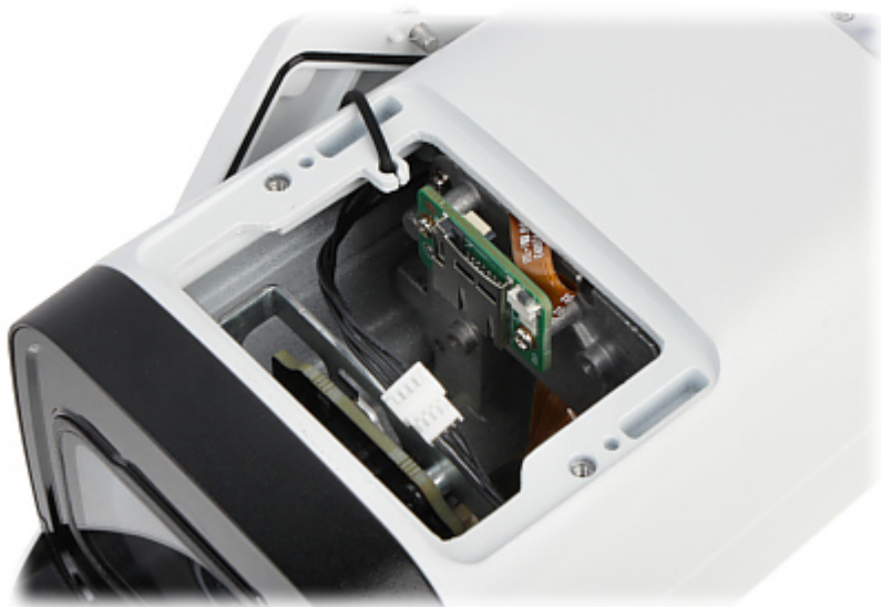
Widok od strony mocowania kamery: