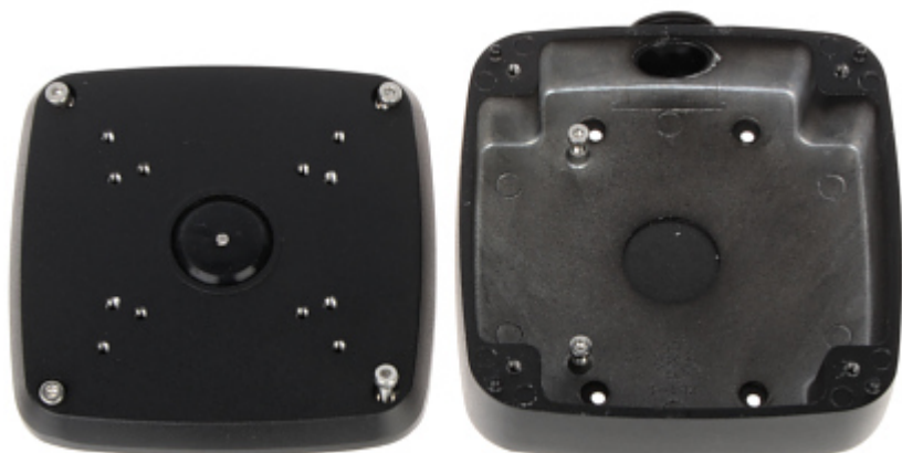
Widok od strony mocowania do ściany: